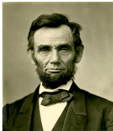
Abraham Lincoln (1809-1865)

Korzystając ze słownika języka polskiego i opierając się na własnych doświadczeniach, sformułuj definicję pojęcia wolność (pamiętaj, by nie był to dosłowny cytat ze słownika) i podaj cztery synonimy tego wyrazu. Następnie uzasadnij przekonanie Abrahama Lincolna wyrażone w zacytowanym zdaniu.