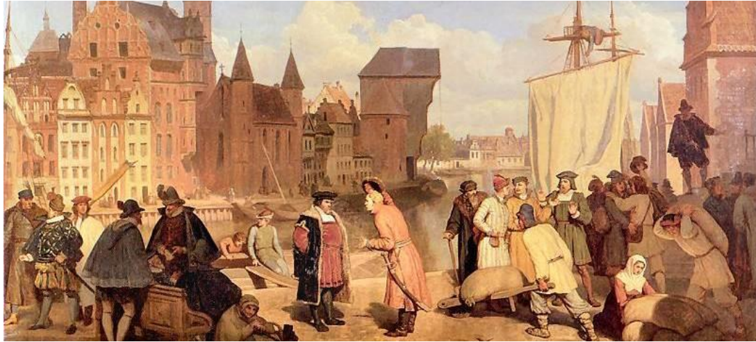
(W. Gerson w: pinakoteka.zascianek.pl)