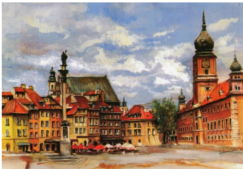
(akwarela Dorota Lincow w: http://widokkraj.blogspot.com/2014/03/..._28.html )