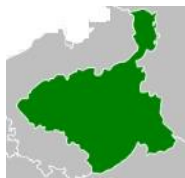
C. Mapa 3.