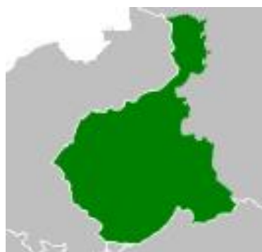
B. Mapa 2.