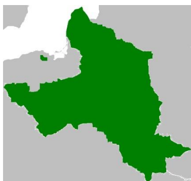
A. Mapa 1.

Na podstawie wiedzy własnej i obowiązującej lektury rozstrzygnij, która mapa przedstawia ziemie Księstwa Warszawskiego. Prawidłową odpowiedź (A, B lub C) otocz kółkiem.