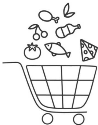
Imagen diseñado por Freepik