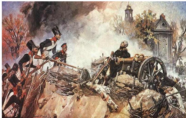
Obraz nr 2

4. Podczas którego powstania rozegrała się bitwa przedstawiona na obrazie nr 2?