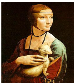
Leonardo da Vinci, Dama z gronostajem