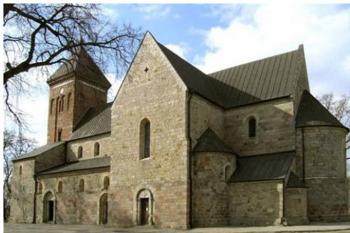
I. Kościół w Kruszewicy