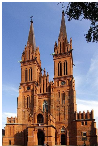
II. Katedra we Włocławku

A. Porównaj 2 ilustracje i określ, w jakich stylach architektonicznych zostały wybudowane przedstawione na nich budowle. (2 p.)