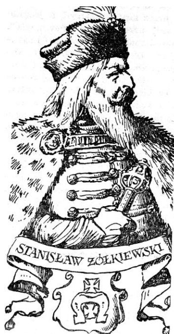
Odp: Cecora, Kluszyn

Zadanie 7. (0-1). Jeden punkt za prawidłowe wpisanie wszystkich czterech nazw.