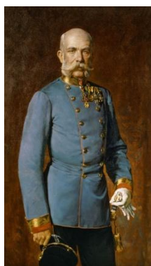
Franciszek Józef I