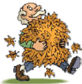
Die bunte Jahreszeit

Przeczytaj uważnie poniższy tekst a następnie znakiem X zaznacz w tabeli, które z podanych zdań są zgodne z jego treścią (richtig-R), a które nie (falsch-F). Za każde poprawne rozwiązanie otrzymasz 1 punkt.